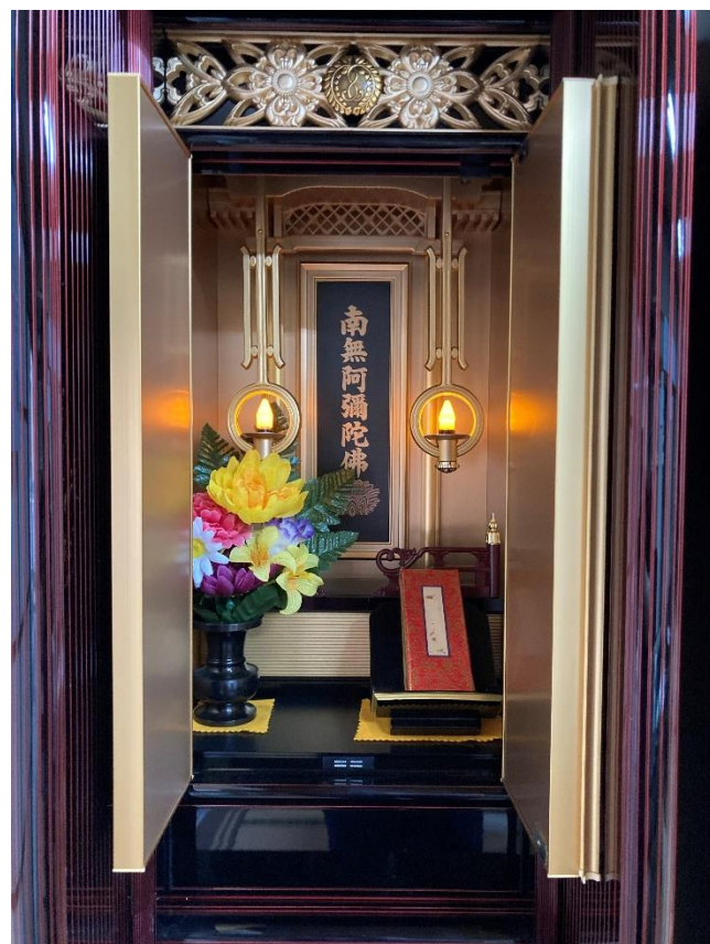
開いた状態/右扉を開けると お灯明が灯ります