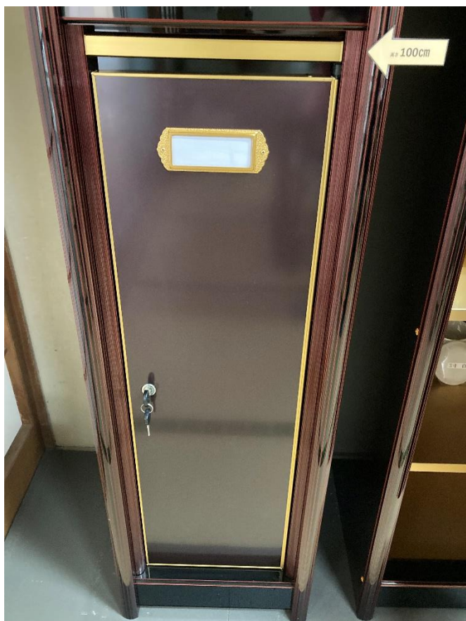
上部にはお名前フォルダー 鍵付