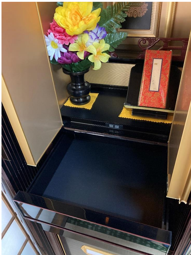
引き出しを開けると収納スペース