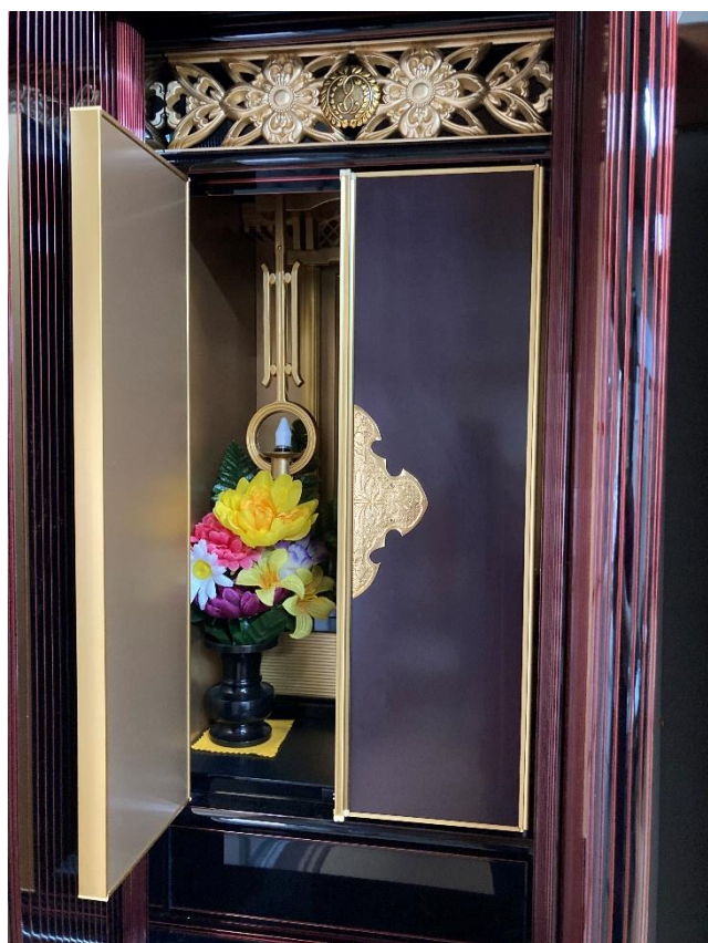
扉は左右に開きます